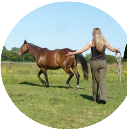
Het paard kan vrijelijk voorwaarts bewegen. Bekken en schouders zijn gericht naar de achterhand.

achterhand van het paard in de richting waarin hij beweegt, kan het paard vrijelijk voorwaarts bewegen. Er staat dan niemand meer op zijn rem en het paard draait zich niet meer om (tenzij het ondertussen een gewoonte is geworden of als het paard de persoon niet vertrouwt). Als we willen stoppen richten we onze schouders en bekken weer naar de voorhand van het paard. Het paard stopt en draait zich om naar ons toe. Op de foto's kan je dit mooi zien.