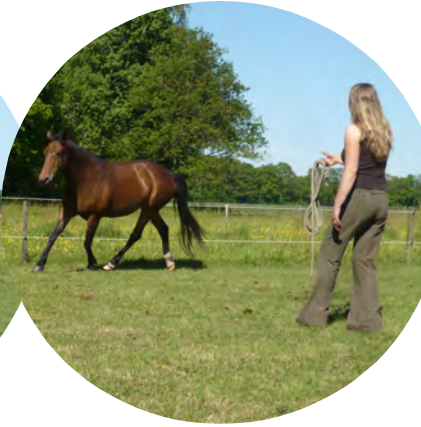
Bekken en schouders gericht naar de voorhand van het paard. Paard buigt naar het midden toe.