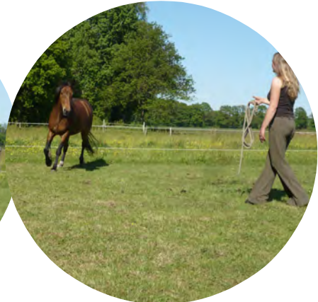
Het paard wordt uitgenodigd om naar het midden te komen

Dit hele 'probleem' is dus eigenlijk alleen maar miscommunicatie. Als wij ons bewuster wordt van onze lichaamstaal en welke betekenis het heeft voor het paard kan de strijd snel oplossen en er een harmonieuze relatie ontstaan.